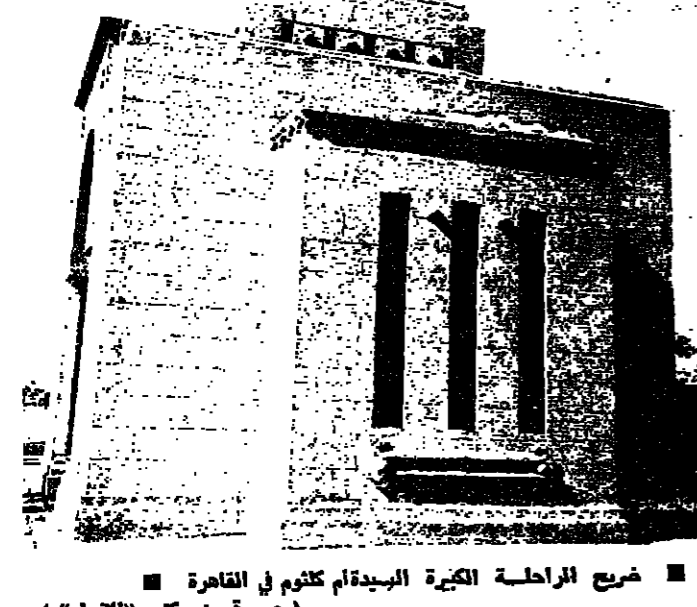
ضريح المرحلة الكبري السيدام كلثوم في القاهرة